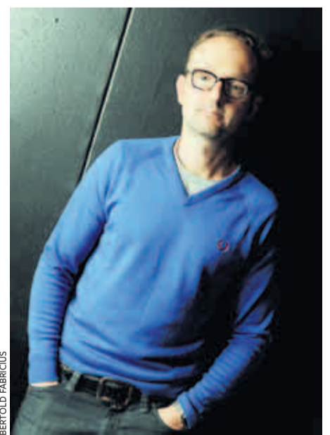
Der Schauspieler Peter Jordan lebt seit zwei Jahren in Berlin. Gestern war er zum vorletzten Mal im „Tatort“ zu sehen

Am Sonntag war Peter Jordan zum vorletzten Mal als Vorgesetzter von Cenk Batu ( Mehmet Kurtulus ) im Hamburger „Tatort“ zu sehen. Seinem Nachfolger Til Schweiger wünschte Jordan, der große Erfolge am Thalia Theater feierte, gute Geschichten: „Ich wünsche ihm vor allem gute Drehbücher, denn das ist das Wichtigste“, sagte er der „Berliner Morgenpost“. Den „Tatort“ bezeichnete Jordan als „träges Format“. „Neuerungen lassen sich nur ganz langsam durchsetzen. Die Idee eines verdeckten Ermittlers, wie ihn Mehmet Kurtulus spielt, war neu und ungewohnt – damit tat sich das Publikum anfangs schwer.“ Zu seinem Umzug nach Berlin, wo Jordan mit seiner Frau, Schauspielerin Maren Eggert lebt, sagte er: „Hamburg ist schöner, Berlin spannender.“