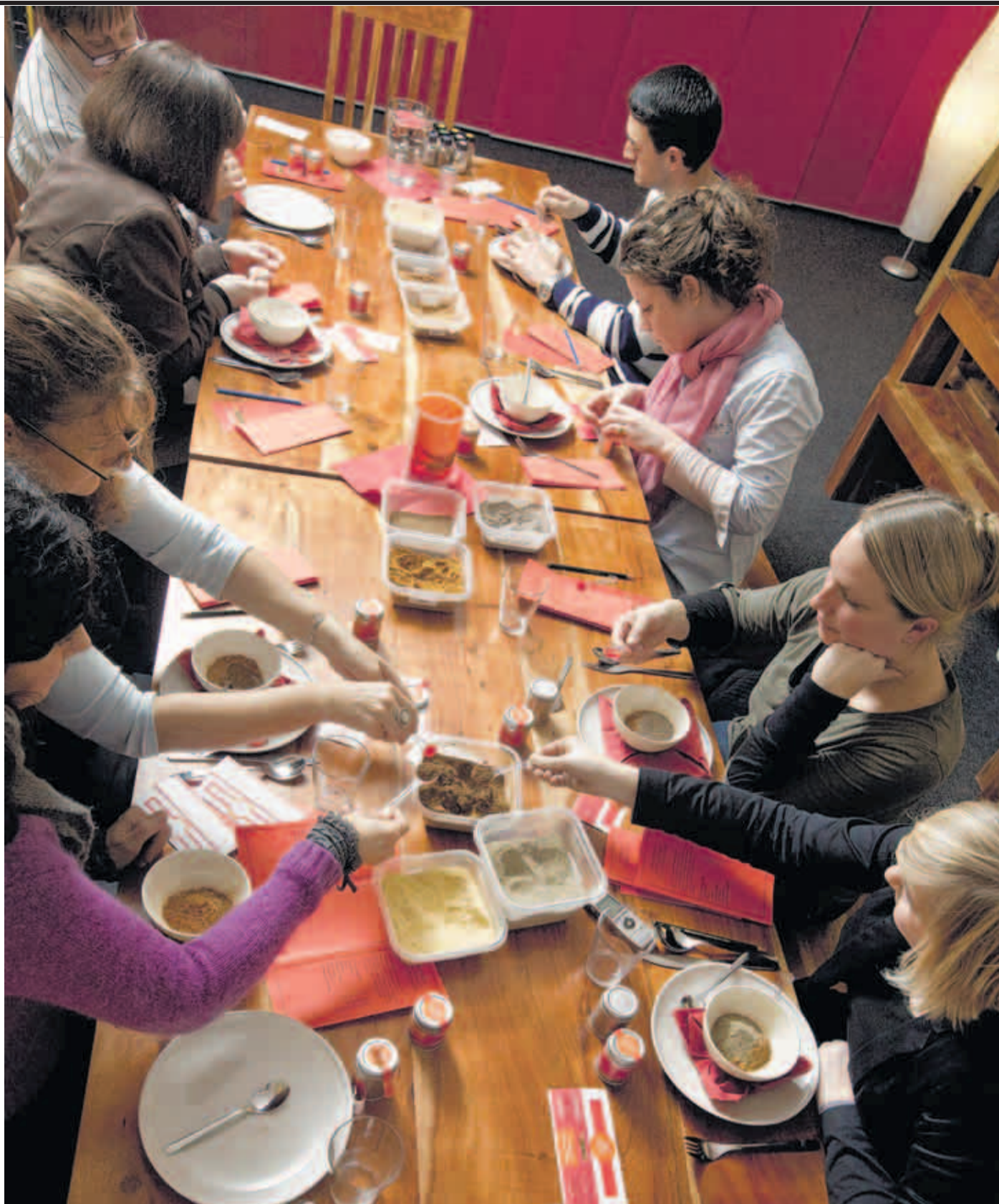
In vielen Farben leuchten die Gewürze aus aller Welt auf dem Tisch – was wozu passt, lernen die Gäste im Seminar

Alle Gewürze werden herumgereicht und beschnuppert. Dabei lassen sich bei unterschiedlichen Arten von Vanille und Zimt Unterschiede entdecken. Zu jedem