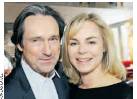
In glücklichen Zeiten: Helmut Zierl und Saskia Valencia waren zehn Jahre lang zusammen, jetzt trennte sich das Paar

ausgeprägten Streitkultur um: „Ich bin dabei sehr laut und brülle“, so Valencia. Am Set der Telenovela „Rote Rosen“ soll sie nun auch ihre neue Liebe gefunden haben: Der 46-jährige Schauspieler Thorsten Nindel wird demnach der Mann an ihrer Seite sein.